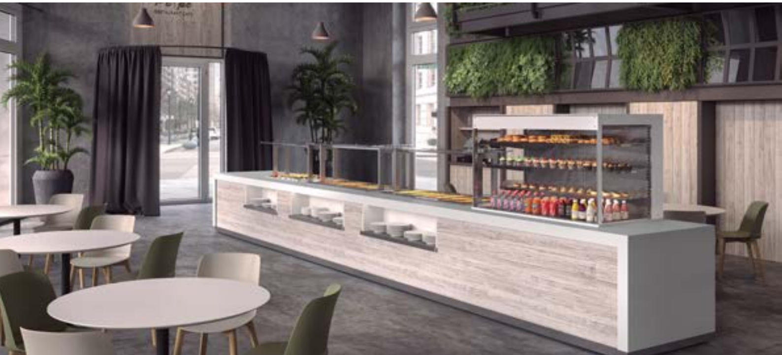
Imagen de archivo, vitrina self service de Infrico.